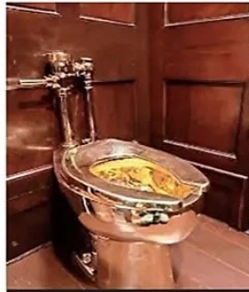
Inodoro obra de Maurizio Cattelan titulada "América".

El juicio por el robo del inodoro de oro valorado en US$6 millones, ocurrido en 2019 en el Palacio de Blenheim, ha comenzado en el Tribunal de la Corona de Oxford. La obra "América", del artista Maurizio Cattelan, fue sustraída por un grupo de ladrones que ingresaron al recinto y se demoraron cinco minutos en consumir el hecho. Pese a que la pieza nunca se recuperó, se presume que fue vendida en partes como oro. Los acusados enfrentan cargos por robo y conspiración. Las pruebas incluyen mensajes, notas de voz y capturas de pantalla.